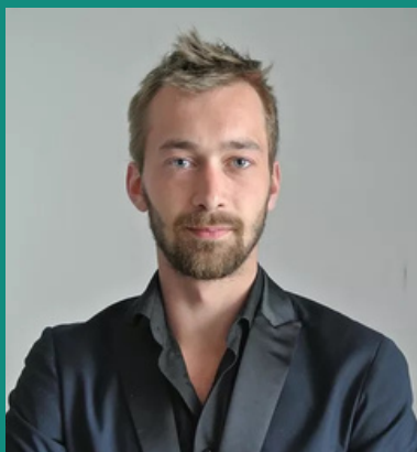
Bastien Forestier Scénographie - Costumes